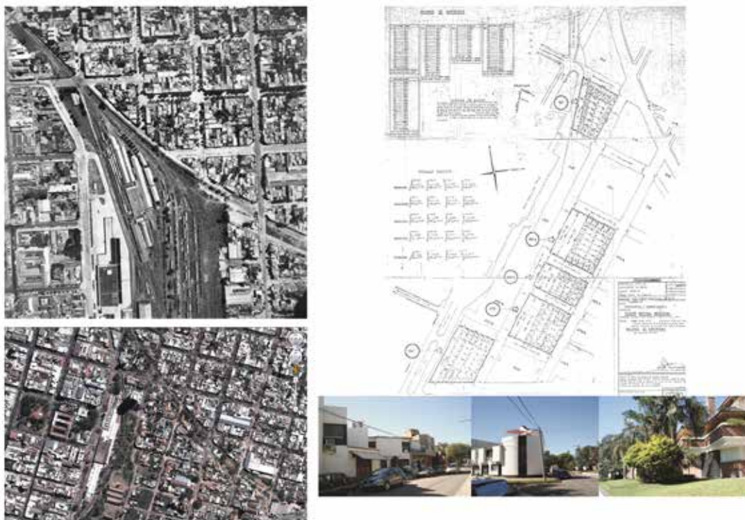
Imagen 3. Transformaciones urbanas en el perímetro de la estación del Ferrocarril de Santa Fe.

Por último, aunque no menos significativo, destacamos las disputas competenciales entre jerarquías del Estado, la discontinuidad de las políticas públicas en el contexto de la fragilidad institucional argentina y los modelos del urbanismo como disciplina en consolidación durante el siglo XX. Estos son condicionantes que han sido anexados a los descritos anteriormente y establecen discontinuidades y rupturas, avances y retrocesos de experiencias específicas que cualifican las dinámicas estructurales. Por ello, retomando la idea de los ciclos, hemos definido para Santa Fe tres fases que van desde fines del siglo XIX a principios del XXI y en las cuales el ferrocarril es visto como oportunidad-problema-oportunidad para la ciudad. Bajo esos tres grandes períodos ordenadores de la dimensión temporal se despliegan las particularidades urbanas que acabamos de describir como respuestas a las interacciones entre lo global, lo nacional, lo regional y lo local. Actualmente, bajo el influjo de la geopolítica china en América Latina y su diplomacia del ferrocarril se están dinamizando nuevas estrategias para la recuperación de las redes de mercancías con un final incierto para las ciudades y, en especial, para Santa Fe, que está sometida a un plan de circunvalación que dejará trazas desafectadas. Su destino urbanístico es un capítulo inacabado y una oportunidad entre comillas para la ciudad.