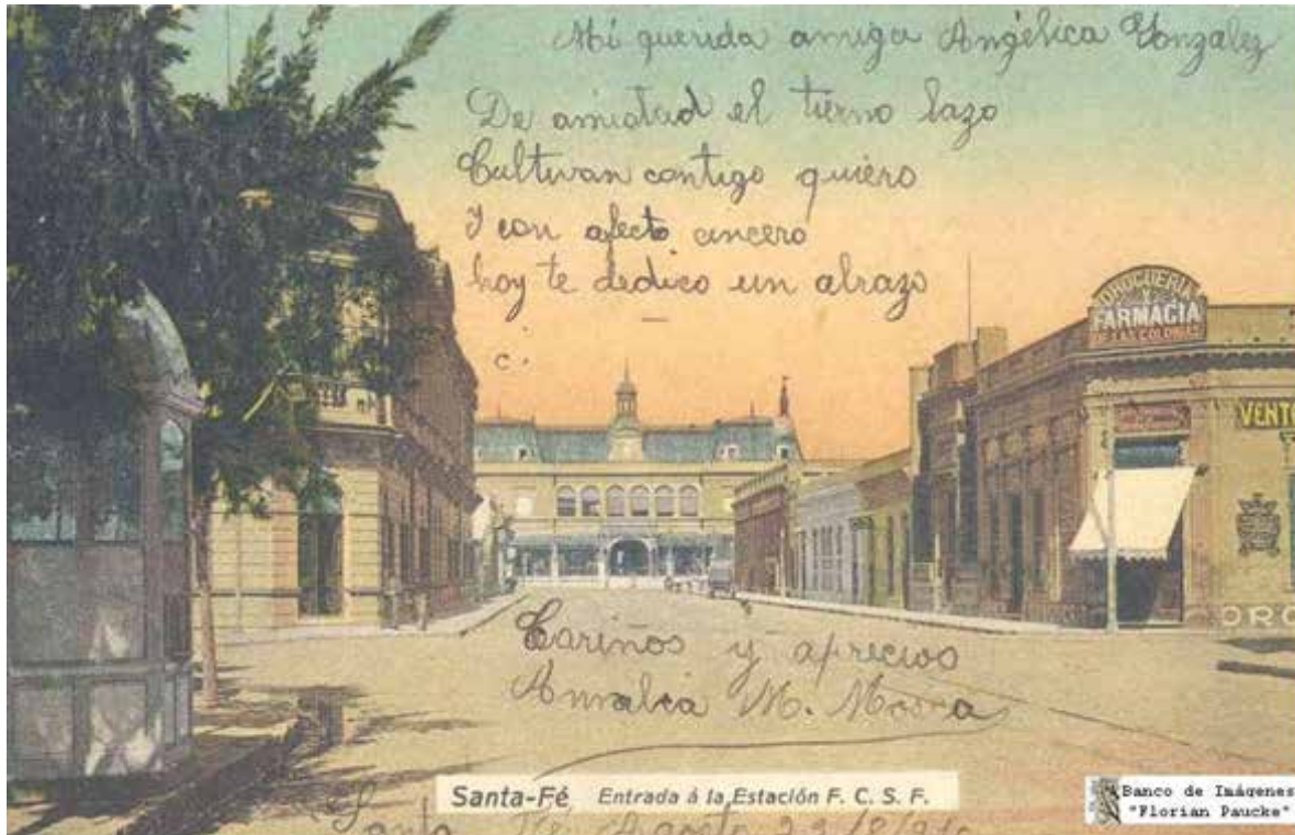
Imagen 2. Cartel y postal de la época de oportunidad de los ferrocarriles en la ciudad de Santa Fe.

El tercer ítem que nos interesa subrayar, como avance hacia un conocimiento que expande las fronteras de la geografía y de la historia urbana, está asociado a las estrategias empresariales de las compañías ferroviarias y a los tipos de estaciones como aspectos condicionantes de las decisiones de localización. En este sentido, no sólo había en Santa Fe áreas urbanas con sus propias lógicas históricas, sino también distintas jerarquías de compañías y estaciones que terminaron reforzando las características iniciales de los vecindarios más que transformando radicalmente su impronta, como se ha sostenido en los estudios clásicos. Como resultado de la tesis afirmamos que es necesario conocer el origen de las compañías, su historia corporativa, la dimensión territorial de sus redes, los tipos de tráfico que movilizaban y si las estaciones construidas eran terminales o intermedias, de pasajeros, de cargas o de tráfico mixto. Esas son pautas para comprender su escala y su arquitectura, pero también explican los sectores de implantación elegidos, las orientaciones de los cuadros de estaciones y las derivas de los procesos de urbanización, los usos del suelo y las prácticas sociales. Así ha quedado plasmado en las tesis en las características urbanas diferenciadas de las tres estaciones analizadas, donde existe cierta correspondencia o determinismo histórico entre la calidad ambiental de los barrios de implantación y la relevancia de cada ferrocarril para la ciudad.